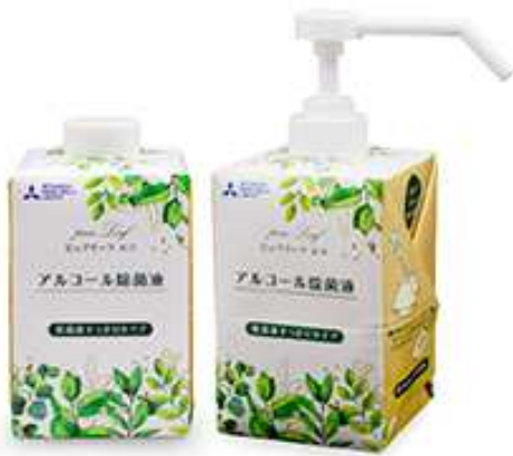
ピュアリーフ エコ

本製品は、従来のプラスチック容器と比較して、石化由来材料を約55%削減することができます。新しい生活様式の中で、環境配慮型製品の提案を通して、持続可能な社会の実現に貢献して参ります。