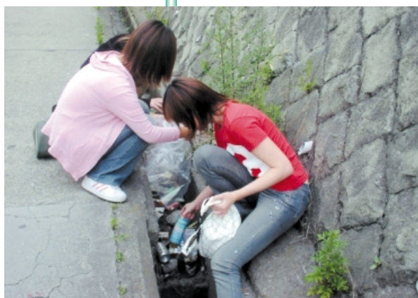
高砂クリーンキャンペーン