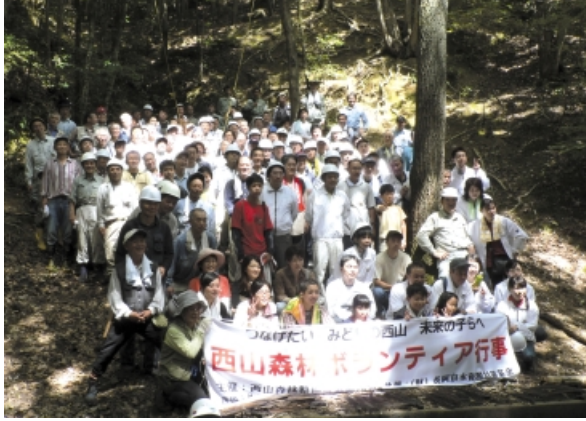
西山森林ボランティア活動

2006年9月17日、西山森林整備推進協議会(京都府長岡京市)主催の「森林ボランティア行事」に参加し、森林を守るため雑木林の除間伐を行いました。 地元企業の社員やボランティアの方など130名が参加しました。