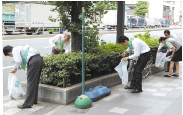
まちかどクリーンデー

NPO法人「はな街道」では、我が国の道路原標がある名橋「日本橋」を拠点とする「中央通り」を四季折々の花で飾り、国際都市東京のメインストリートにふさわしい「景観の保全」と「さらなる賑わいの創出」を目指しています。