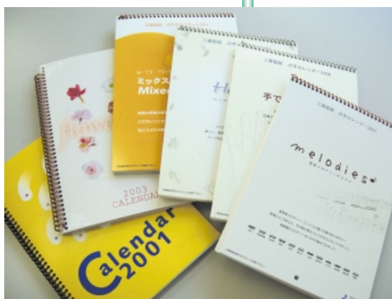
これまでに制作した点字カレンダー