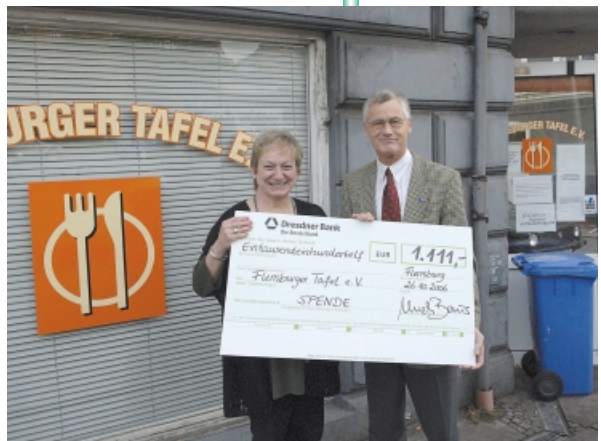
フレンスブルガー・ターフェル

MPFでは、このような活動を尊重し、支援を続けています。写真は、MPFの工場長が模擬店の売上金(1,111ユーロ)を、『フレンスブルガー・ターフェル』の代表に手渡しているところです。