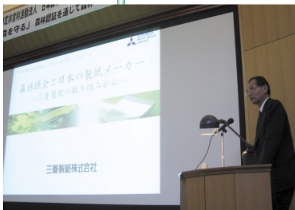
記念シンポジウムでの 社長講演

「みどりの小道」ホームページ http://www.midorinokomichi.net/