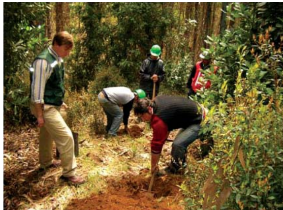
ケウレ苗木の植え付け

右の写真は希少植物の維持・管理の様子です。希少植物であるケウレ（学名 Gomortega）がチリ植林地内に生育していることから、種子を採種して苗畑内で育て、苗木を再度山林に植付け、定期的な下草処理を行うなど、ケウレ林の維持・管理に努めています。