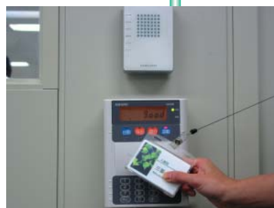
ICカードによる出・退社時間の把握

全社的な勤怠管理や諸届けの電子化に伴って、客観的な労働時間の把握を行い、過重労働・長時間労働を防止していく管理を今年度中に順次導入する予定です。（三菱製紙本体）