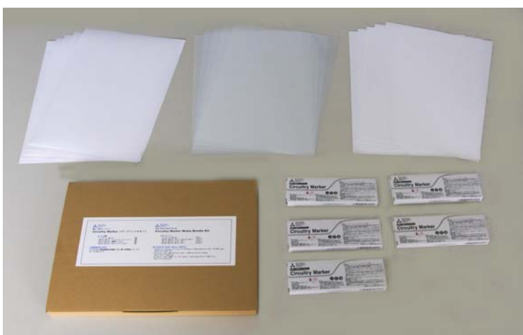
Circuitry Markerメディアバンドルキット 外観、及びキット内容