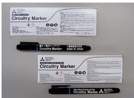
Circuitry Marker 外観

また通常、専用メディアはA4 100枚単位で販売しておりますが、お手軽にご利用いただけるよう、3種の異なるタイプの専用メディアと銀ナノ粒子インクペンをセットにした「Circuitry Markerメディアバンドルキット」も併せて発売いたします。