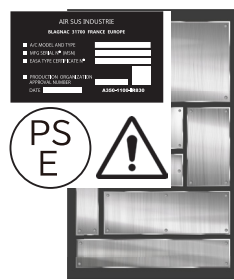
レタープレス製版